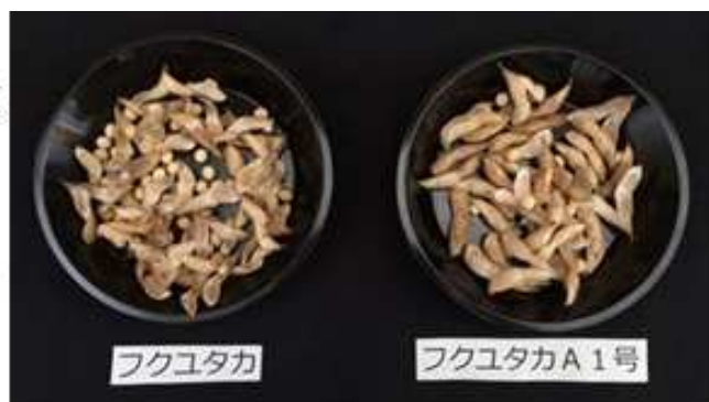
裂莢性の比較（60℃乾熱で9時間処理）